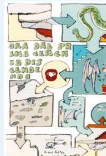
Particolare dall'opera di Gianfranco Baruchello, litoserigrafia stampata in 170 esemplari numerati e firmati a lapis dall'artista.

La mostra è un dialogo d'arte tra passato, presente e futuro e in mostra ci sono anche i nuovi lavori di Emanuela Marrella artista del PAG Inverart.