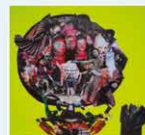
Particolare dal lavoro di Emanuela Marrella artista del PAG Inverart, dedicato al V Canto dell'Inferno.