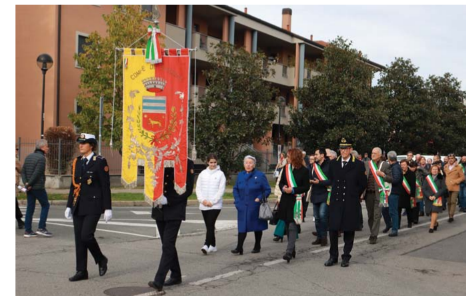
Tre immagini dell'inaugurazione della Fiera, con la tradizionale sfilata per le vie del paese