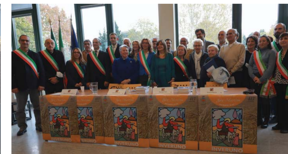
Il taglio del nastro degli stand commerciali e un momento della cerimonia in sala Virga