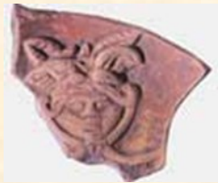
Disco figurato con testa di medusa

Recenti scavi hanno portato alla luce una necropoli romana con numerosi reperti che testimoniano la forte presenza romana sul territorio