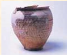
Oletta decorata con bugnette

Nel XIII sec. il territorio di Inveruno apparteneva al Capitolo di S. Ambrogio di Milano e fu sede di un monastero occupato da suore.